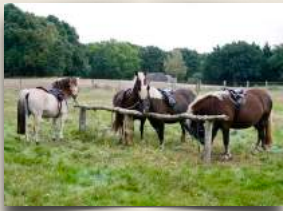
Unsere Therapiepferde vor einem Ausritt in den Staatsforst Göhrde

Wir verfügen über ein umfassendes einrichtungsinternes Therapieangebot in den Bereichen Psychotherapie, Ergotherapie, Reittherapie und Sporttherapie. Die zur Anwendung kommenden Therapieformen werden individuell auf die Bedürfnisse jedes einzelnen Kindes bzw. Jugendlichen abgestimmt und sind fester Bestandteil unserer Arbeit. Darüber hinaus gibt es spezielle therapeutische Gruppenangebote, z.B. Mädchengruppen, Jungengruppen, Aspergergruppen und Kochgruppen.