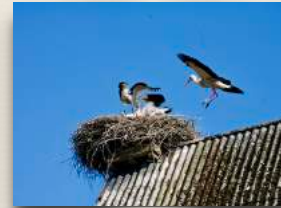
Einige der Penkefitzer Störche

Dannenberg liegt ca. 4 km von Penkefitz entfernt. Es ist eine kleine Stadt mit knapp 9000 Einwohnern. In Dannenberg befindet sich unsere Verwaltung, unser Therapiezentrum für Psychotherapie und Ergotherapie, unsere Reithalle und die Elbe-Jeetzal-Schule gGmbH. Das Freizeitangebot in Dannenberg ist vielfältig.