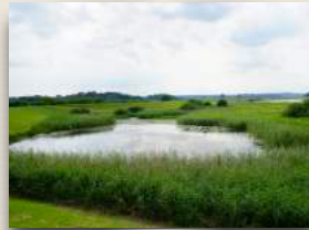
Die Taube Elbe vor Penkefitz

In Penkefitz hat alles angefangen. In diesem kleinen Dorf im niedersächsischen Wendland inmitten des Biosphärenreservats Elbtalau. Nördlich des Dorfes fließt die Elbe und östlich liegt der Penkefitzer See.