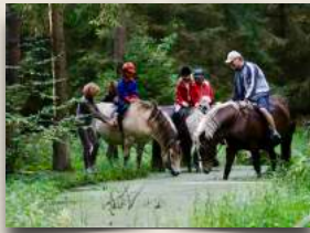
Reittherapie, Ausritt in die Göhrde