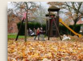
Dorfplatz in Penkefitz