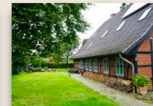
Wohngruppe Penkefitz Nr.5