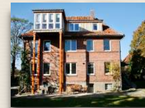
Wohngruppe Lüneburger Straße