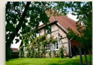
Wohngruppe Penkefitz Nr.14