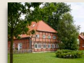
Wohngruppe Niestedter Weg