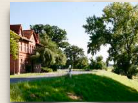
Wohngruppe Penkefitz Nr.13

Jedes Kind hat eine/n BezugsbetreuerIn, die/der sich um die schulischen und alle persönlichen Belange seines Bezugskindes kümmert. Die/der BezugsbetreuerIn führt auch die regelmäßigen Telefonate mit den Eltern und tauscht sich mit ihnen u.a. über den aktuellen Entwicklungsstand ihres/seines Bezugskindes aus. Auch die Telefonate zwischen den Kindern und ihren Angehörigen werden verlässlich eingehalten. Ab fünfzehn Jahren dürfen die Jugendlichen bei uns ein eigenes Handy besitzen (u.a. Inhalt unseres internen HWP-Medienkonzeptes). Sofern möglich, finden regelmäßige Besuche bei der Familie statt. Dafür wird mit allen Beteiligten eine individuelle Besuchsstruktur erarbeitet. Bei Bedarf steht ein Fahrdienst zur Verfügung.