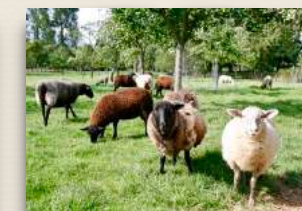
Wohngruppe Penkefitz Nr.14