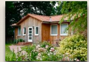
Verselbständigungsappartement Penkefitz Nr.105